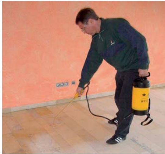
Sprühaufrag einer wässrigen Imprägnierung

achten, d. h. Fenster und Türen sollten geöffnet (Durchzug) und ggf. Lüftungen auf »manuell« und auf volle Stärke (Lüftung rund um die Uhr) gestellt werden. Bei ausreichender Lüftung werden die MAK-Werte nicht überschritten. Bei lösemittelhaltigen Produkten ist aufgrund der Vernebelungen ein geeigneter Atemschutz zu tragen. Für wässrige Produkte ist dies im Allgemeinen nicht notwendig. Die Raumtemperatur sollte generell 15 bis 25 °C betragen (nicht wärmer!).