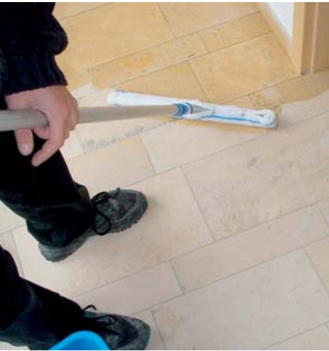
Auftrag einer wässrigen Imprägnierung mittels Applikator